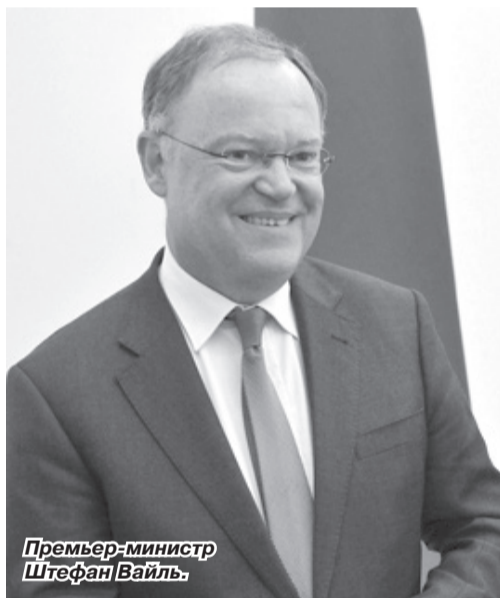
Премьер-министр Штефан Вайль.

В ходе встречи главы регионов-партнеров обсудили сотрудничество и перспективы взаимодействия как в гуманитарном, так и в экономическом направлениях. Также был подписан План мероприятий на 2016 год в рамках Совместного заявления об укреплении партнерского сотрудничества.