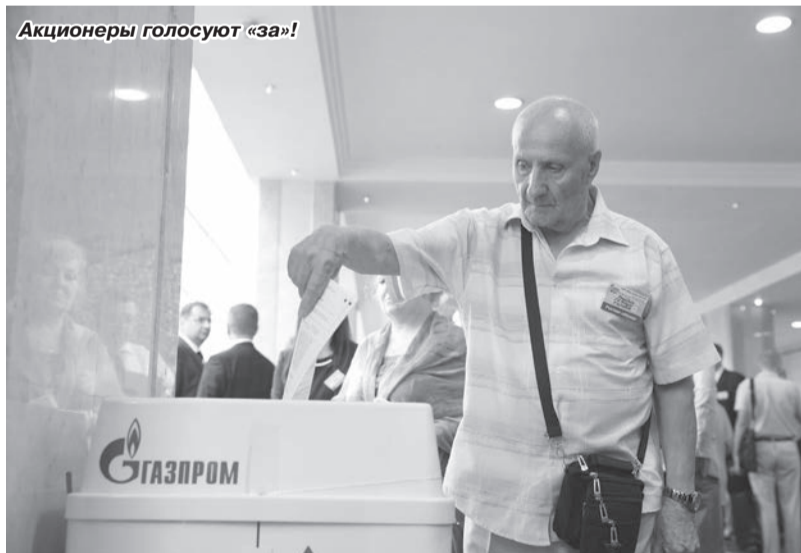
Акционеры голосуют «за!»

По итогам прошлого года, несмотря на снижение спроса на электро-